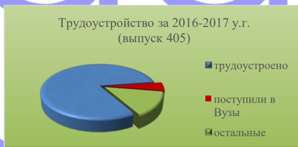
Рис.3 – Диаграмма трудоустройства выпускников за 2016-2017 учебный год.