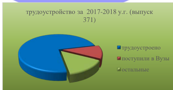
Рис.4 – Диаграмма трудоустройства выпускников за 2017-2018 учебный год.