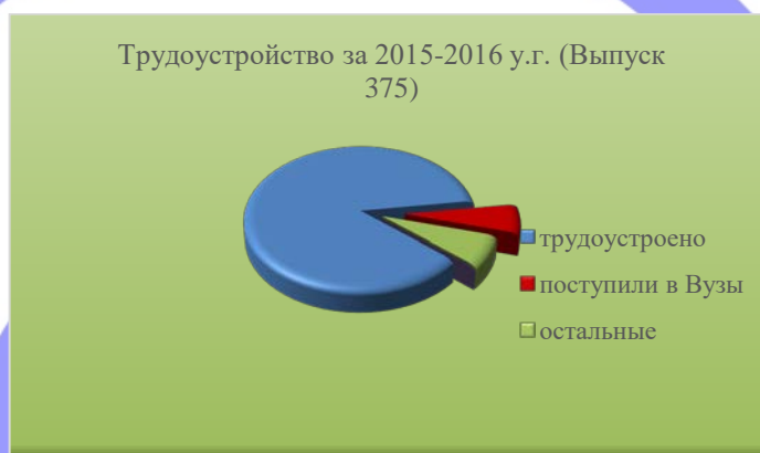
Рис.2 – Диаграмма трудоустройства выпускников за 2015-2016 учебный год.